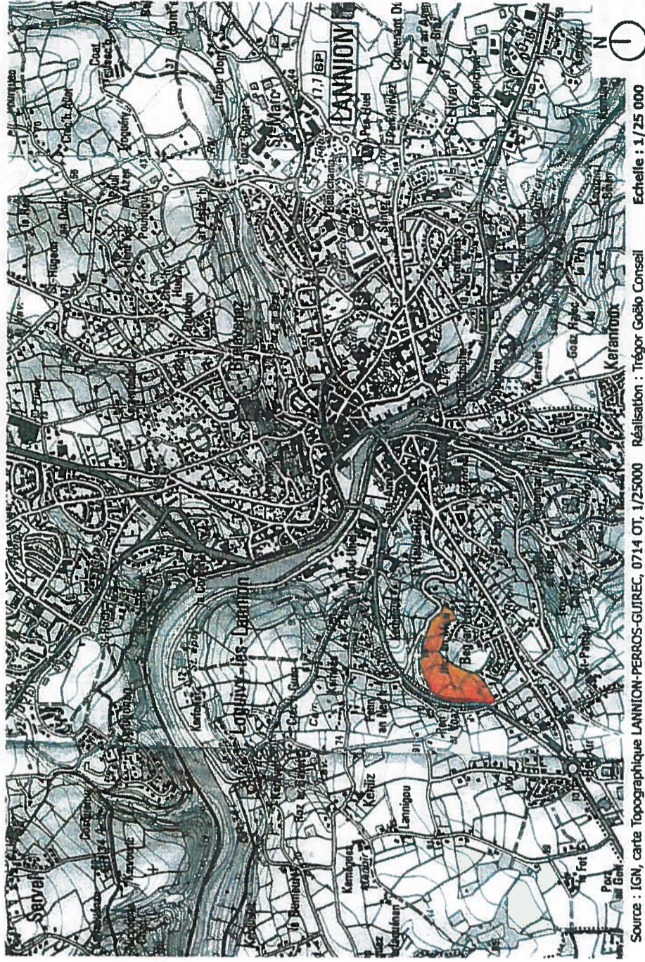
Réalisation : Trégor Goëlo Conseil Echelle : 1/25 000