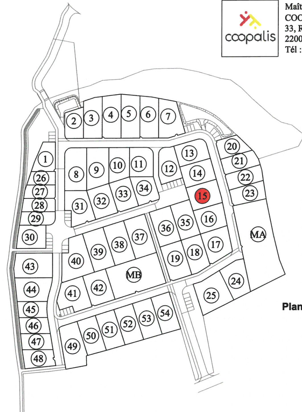
Plan du Lotissement

Maitre d'ouvrage COOPALIS 33, Rue Abbé Garnier - BP 203 22002 SAINT-BRIEUC Tél : 02 96 94 04 72