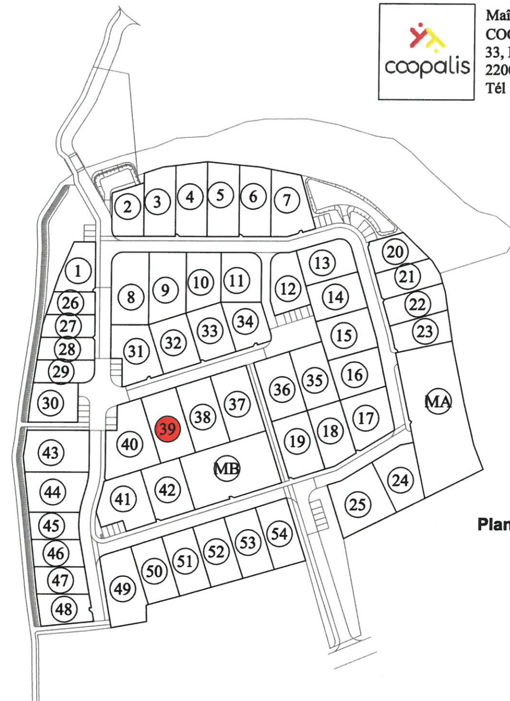
Plan du Lotissement

Maître d'ouvrage COOPALIS 33, Rue Abbé Garnier - BP 203 22002 SAINT-BRIEUC Tél : 02 96 94 04 72