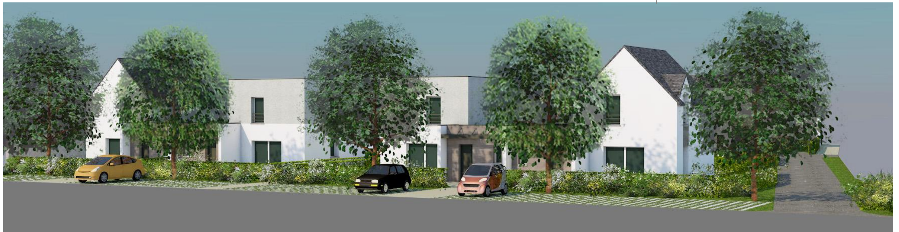
PERSPECTIVE SUR RUE