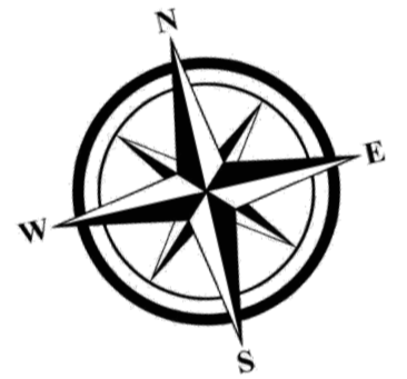
PLAN DE MASSE ECH 1/250